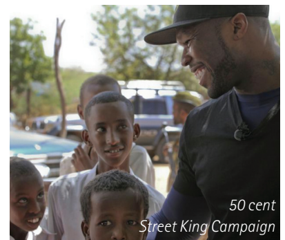
50 cent Street King Campaign

50 Cent komt zijn beloftes na. Hij maakte in september vorig jaar bekend dat hij een miljard maaltijden doneert aan het Wereldvoedselprogramma. De 36-jarige rapper bezocht Somalië en Kenia namens het Wereldvoedselprogramma van de Verenigde Naties. Hij zette de Street King Campaign op, met als doel de wereld wakker te schudden. Er moet meer aandacht komen voor de hongersnood en armoedeproblemen in bepaalde regio's van Afrikaanse landen. Fifty is de bedenker van het energiedrankje Street King. Met de promotie van het drankje, hoopt hij op big business . Per verkocht blijke gaat er tien dollarcent naar het goede doel. ABC News verslaggever Dan Harris vergezelde Fifty tijdens zijn reis en voor de documentaire Nightline . Ze bezochten samen een school in de sloppenwijken van Nairobi en een vluchtelingenkamp in het Somalische Dolow. De G-unit generaal was zeer onder de indruk. De ABC-News reporter twitterde dat hij de goedgebekte rapper zoals wij hem kennen nog nooit zo heeft gezien. "Wat ik zie is afschuwelijk, deze mensen hebben onze hulp nodig", zei 50 Cent. De ontmoeting met de kinderen vond hij inspirerend. "Ze hebben helemaal niets, maar zijn ontzettend positief en optimistisch." Je kunt Fif op Twitter volgen waar hij foto's post over zijn reis in Afrika.