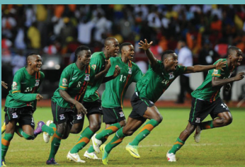
Chipolopolo Winaars Africa Cup

Dit jaar werd the Africa Cup of Nations voor het eerst ge-co-host door 2 landen: Gabon en Equatoriaal Guinee. De twee landen kregen de organisatie toegewezen, boven Nigeria, Angola en Libië. Belangrijkste afwezige op het toernooi was titelverdediger Egypte. Zij eindigden zelfs als laatste in hun kwalificatiegroep.