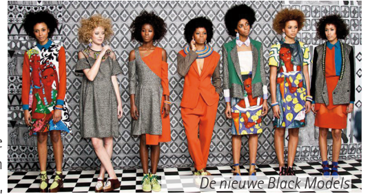
De nieuwe Black Models

Ook Vogue gaat eindelijk mee met de laatste trend binnen de zwarte gemeenschap,